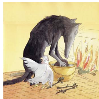
Sopa de pedra