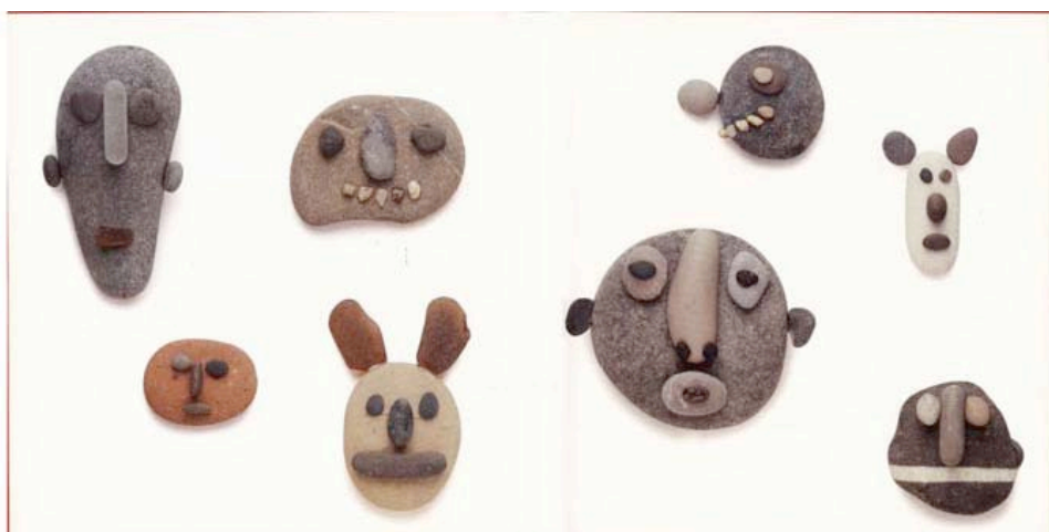
Pedra a pedra

Les il·lustracions es poden agrupar atenent criteris diferents: les diferents formes i colors en què es dibuixen les pedres; si es tracta de pedres aïllades o pedres en conjunt; relació amb els personatges; la manera de cuinar-les,