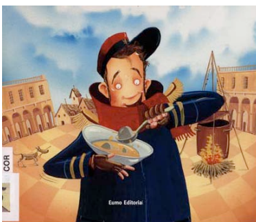
Sopa de pedres