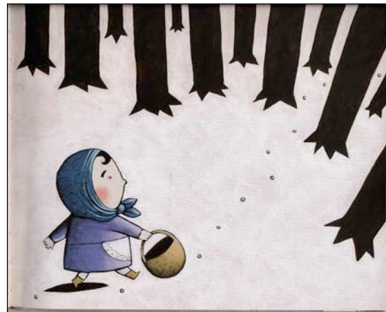
Pedra, pal i palla