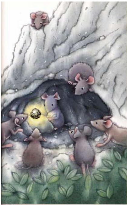
Rufus i les pedres